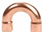
Serie 5060 - Curve F/F a 180°