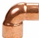
Serie 5090R - Gomiti ridotti M/F a 90°