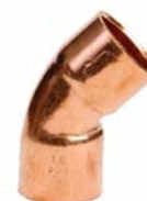
Serie 5041 - Curve F/F a 45°