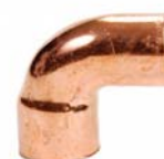
Serie 5092 - Gomiti M/F a 90°