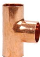
Serie 5130 - Tee F/F/F