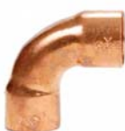
Serie 5002 - Curve F/F a 90°