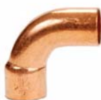
Serie 5001 - Curve M/F a 90°

Disponibili anche, su richiesta, in versione adatta per applicazioni ad alta pressione (fino a 120 bar).